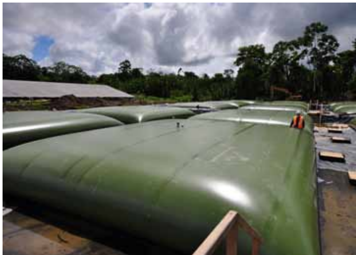
Patio de tanques en Perú.