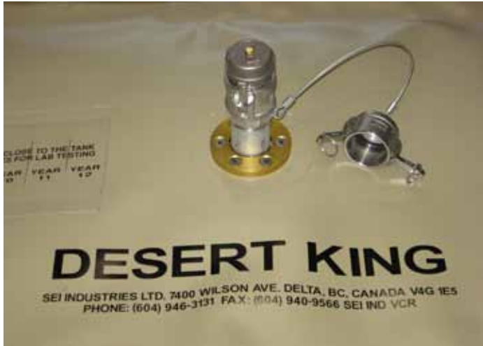
Válvula de ventilación del tanque Desert King™

SEI Industries puede suministrar el Desert King™ como un tanque independiente o como parte de un sistema completo de combustible llave en mano, el cual incluye: